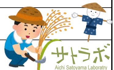
サトラボ Aichi Satoyama Laboratory