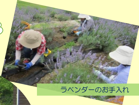
ラベンダーのお手入れ