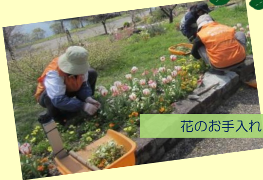
花のお手入れ・除草