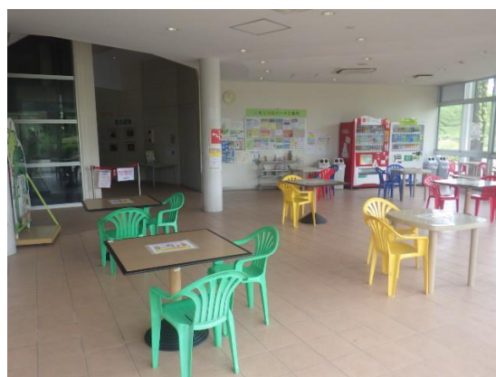
③多目的イベントスペース