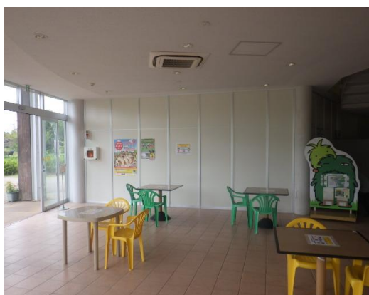
②多目的イベントスペース 面積 30 m 2