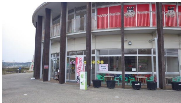
①花の広場休憩所 1階正面