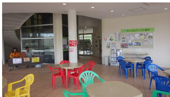
③多目的イベントスペース