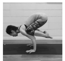
Yoga 美 Vayu ヨガ ヴィヴェ

豊田市&みよし市を中心にヨガスタジオやダンススタジオにてヨガクラスを担当しています。