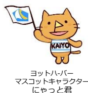
ヨットハーバー マスコットキャラクター にゃっと君

動きやすい服装、ヨガマット(事前予約でレンタル可能) 汗拭きタオル、飲み物、着替え(必要に応じて)