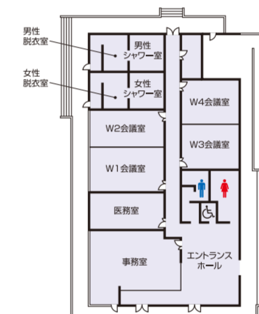
クラブハウス西棟平面図