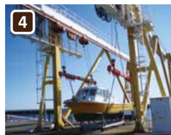
クレーンとハーバー救助艇