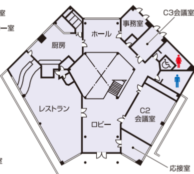
クラブハウス中央棟2階平面図