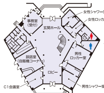
クラブハウス中央棟1階平面図