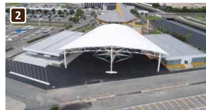
センタープラザとクラブハウス西棟・東棟