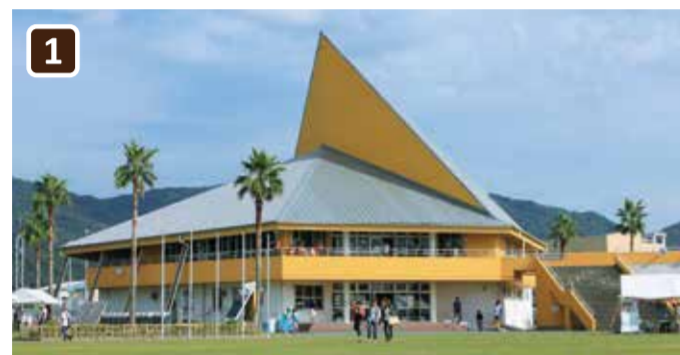
クラブハウス中央棟