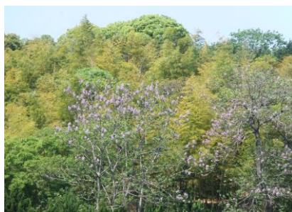
遠くに竹林・キリの花