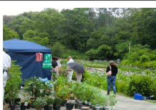
花ショウブまつり（昨年）

■ 今年も花ショウブまつりを五月三十一日（日）と六月八日（日）まで開催しますので見に来て下さい。