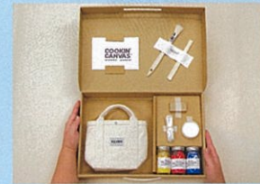
SILVER 帆布バッグ、生活用品