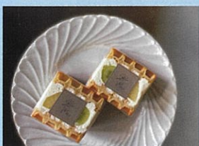
OLU 生菓子、焼菓子、ドリンク