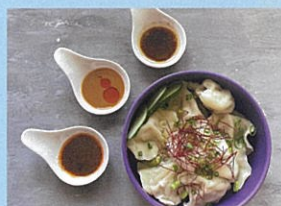
CLOTH OVER 拌麵、手作り水餃子