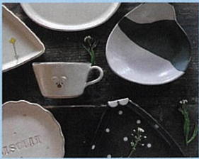
アトリエ モノ・ラー