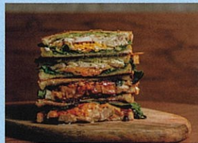
daybyday from BURGER STAND haveagoodtime. グリルサンド、スープ、ドリンク各種