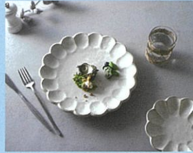
カネコ小兵製陶所