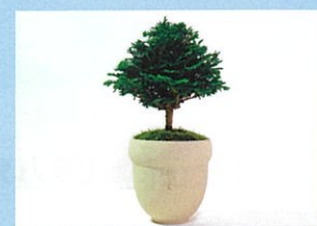
三寒四温 盆栽、盆栽鉢