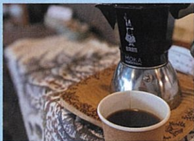
喫茶 私と糧々 珈琲、焼菓子