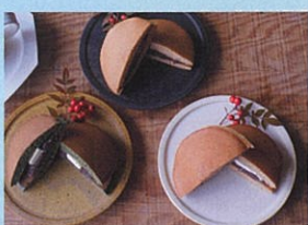
暮らしの工房 こねり 珈琲、生どら焼き、各種ドリンク