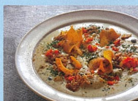
グルテンフリー食堂 おみやはん 四川麻婆、各種カレー、米粉の焼きドーナツ