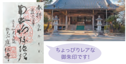
ちょっぴりレアな 御朱印です!