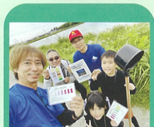
水環境モニタリング