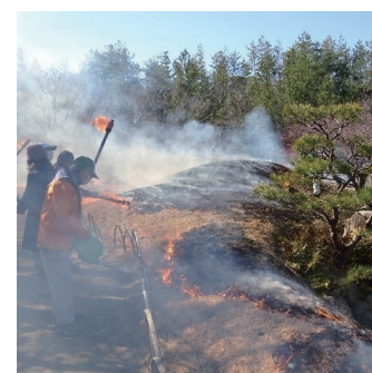
日本庭園の「芝焼き」